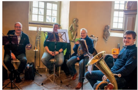
Schoko für den Posaunenchor.