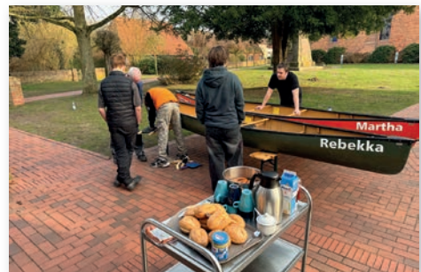
Reparatur der Kanus

Und wie im vergangenen Jahr wurden wieder Kanus repariert. Dieses Mal waren die Sitze dran. Alte marode Holzsitze wurden durch neue, bequemere Sitze ausgetauscht. Das Wetter hat mitgespielt und es wurde viel geschraubt und gesägt. Zwischendurch gab es aber auch eine Stärkung!