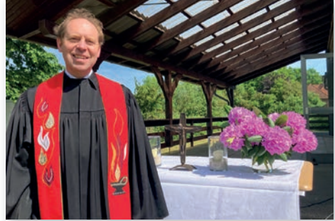
Im Einsatz zu Pfingsten in Barme.

Vieles, lieber Rolf, stärkt immer wieder deinen Glauben und lässt dich mit