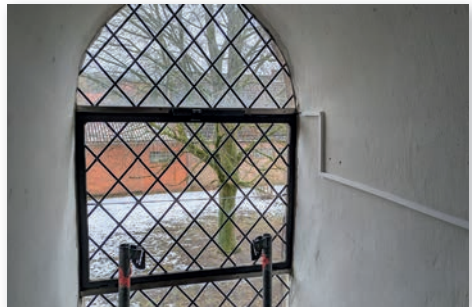
Fenster Süd.

diese Maßnahme aus den Baumitteln des Kirchenkreises bezahlt.