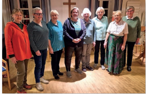
Die Vorbereitungsgruppe des Weltgebetstags.

Es ist einfach unglaublich! Dass weltweit einmal im Jahr am Weltgebetstag derselbe Gottesdienst gefeiert wird. Organisiert von ganz unterschiedlichen Frauen dieser Welt. Dass jedes Jahr auf's Neue eine ökumenische Gruppe Frauen aus unserer Region Süd ein so schönes Programm gestaltet und anschließend die landestypischen Speisen probiert werden können. Jede und jeder ist ganz herzlich willkommen. Nigeria: das bevölkerungsreichste Land Afrikas. Ein Land, dass nicht unterschiedlicher sein könnte zwischen arm und reich, zwischen Wüste und Wasser. Und doch ist dort eine Gemeinsamkeit: der Glaube. Zwar in unterschiedlichen Religionen, aber der Glaube an sich, treibt die Menschen dort an, in widrigsten Umständen und Situationen weiterzumachen und durchzuhalten. Ich bewundere die Stärke der Menschen, insbesondere der Frauen. Wir hörten drei Geschichten von Frauen, die im Alltag unfassbar arbeiten, emotional kämpfen und leiden müssen. Schicksalsschläge, wenn ihnen die Männer durch Krieg und Überfälle