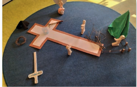
Osterzeit im Kindergarten

Nach der dunklen Winterzeit werden die Tage wieder heller, Blumen beginnen zu blühen und überall ist neues Leben zu entdecken. Diese besondere Zeit erinnert uns auch an die Osterbotschaft: Gott schenkt neues Leben, Hoffnung und Freude. Gemeinsam mit den Kindern haben wir einen Ostergottesdienst gefeiert. Dabei legten die Kinder ein großes Osterbild, während die Ostergeschichte mit Bildern erzählt und vorgetragen wurde. So konnten die Kinder die Geschichte von Ostern auf eine anschauliche und lebendige Weise erleben. Im Anschluss blieb noch Zeit für ein gemütliches Beisammensein. Bei von den Eltern gebackenem Kuchen und einer Tasse Kaffee konnten Kinder, Eltern und Mitarbeitende miteinander ins Gespräch kommen. Mit einem leckeren Osterfrühstück im Kindergarten verabschiedeten sich die Kinder in eine erholsame Woche Osterferien.