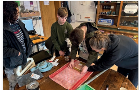
In der Wehrke in Westen.

Dann gab es noch das Werken in der Wehrke - der offenen Werkstatt in Westen. Hier wurden Motive aus dem Laserdrucker mit Lavendelöl auf T-Shirts und probenhalber auf ein Handtuch gedruckt.