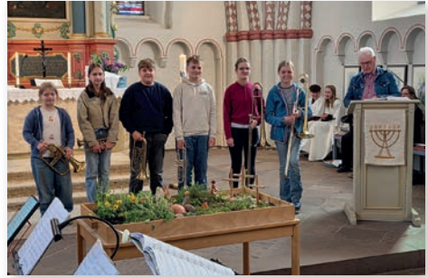
Die aufgeregten JungbläserInnen