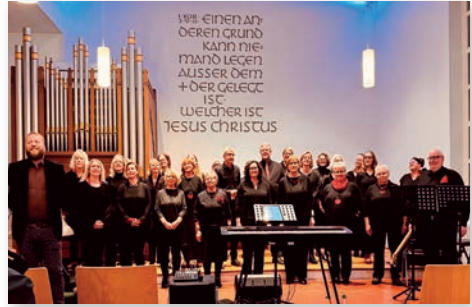
Der Gospelchor Etelsen

Die Zuhörer und Zuhörerinnen erwartet ein Programm, das Brücken schlägt und eine musikalische Reise durch verschiedene Genres bietet. Es wird ein Bogen gespannt von traditionellen Gospelsongs über bekannte Filmmusik bis hin zu modernen Popsongs. Feinfühlig, christliche Textüberarbeitungen verwandeln diese in mitreißende Gospels.