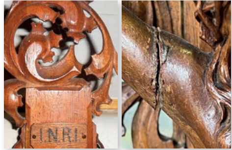
Einige schadhafte Stellen am Kreuzifix.