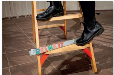
Wofür stehe ich?