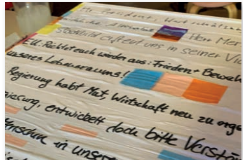
Was würden wir Politikern gern sagen