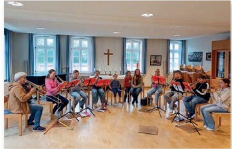
Nachwuchs der Jungbläser gesichert.

Welches sind eure Lieblingsstücke? „Jingle Bells“, „Bruder Jakob“, „Allein