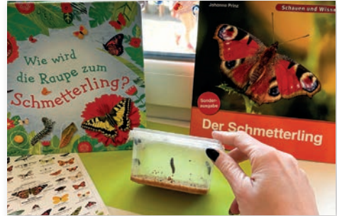
Raupen im Kindergarten

Für unsere „schlaun Fühse“, die Vorschulkinder, beginnt nun der Endspurt im Kindergarten. Die Aufregung wächst, denn der letzte Kindergarten tag rückt immer näher und ein neuer Lebensabschnitt steht bevor.