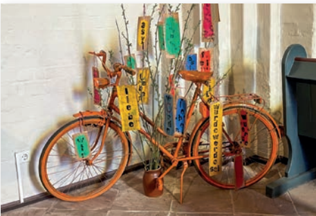
Worte aus Menschenrechten, die uns auf dem Weg begleiten