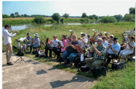
Einsatz beim Allergottesdienst im Juni.