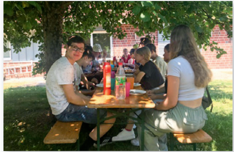
Nachtreffen der Konfirmierten.

Am Sonntag, den 11. Juni, wurde der frisch konfirmierte Jahrgang aus unserer Region zum Grillen ins Gemeindehaus nach Westen eingeladen. Bei strahlendem Wetter wurde im Garten unter dem Baum im schützenden Schatten gemeinsam gegessen und erzählt. Bei Wikinger Schach und Fußball hatten alle ihren Spaß.