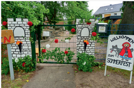
Eingang ins Märchenland.

Zum Abschluss spielte das Kindertheater Schnurzepiepe aus Bremen noch das Märchen „Rotkäppchen und der GUTE Wolf“! Alle Gäste, Groß und Klein, gingen mit einem selbstgemachten „Liebesapfel“ aus unserer hofeigenen Hexenküche zufrieden nach Hause.