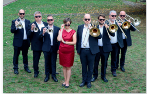
Sie „posaunen“ Gottes Botschaft in die Welt.

Posaunenchöre füllen mit ihrem Klang den ganzen Kirchenraum, sie gestalten Gottesdienste im Freien, sorgen für Musik im Altenheim, bei Gemeindefesten, zu Jubiläen und anderen Anlässen. Posaunenchöre sind aber noch mehr als Musik: Sie sind eine ganz besondere Gemeinschaft von musizierenden Menschen jeden Alters, die sich unter dem Dach der evangelischen Kirche zusammenfinden, um gemeinsam die christliche Botschaft in die Welt zu „posaunen“.