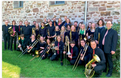
Freuen sich auf das Konzert in Dörverden.