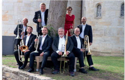
Die Mitglieder des Ensembles der Landesposaunenwarte.