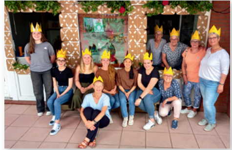
Die „königlichen“ Häupter: Unser KiTa-Team und Helferinnen vor dem Hexenhaus.

In jedem Jahr werden unsere werden- den Schulkinder gebührend verabschiedet. Auf einer Fahrt mit Bus und Zug nach Bremen in das Überseemuseum gab es viel zu entdecken. Aber noch aufregender war das Beobachten des bunten Treibens auf dem Bahnhofsvorplatz, ein schlafender Mann auf der Parkbank, Polizisten überprüfen laut singende Jugendliche, eine klingelnde Straßenbahn und viele reisende Leute mit Gepäck. Als unser geplanter Zug zur Rückfahrt nach mehrmaliger Verspätung am Ende doch ganz ausfiel, begann unser Reisemarathon. Schnell von Gleis 1 zu Gleis 5, dort fährt ein Zug mindestens bis Verden. Gesagt getan! Gut, dass wir im Vorfeld geübt haben, zu zweit zu gehen und auch im Bahnhofsgetümmel seinen Partner nicht loszulassen oder gar zu verlieren. Nach einer Zug- und Taxifahrt zum Kindergarten, Duschaktion und leckeren Pommes, ging ein toller Tag zu Ende.