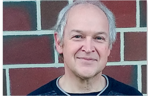
Seit über 40 Jahren prägt er unseren Posaunenchor.