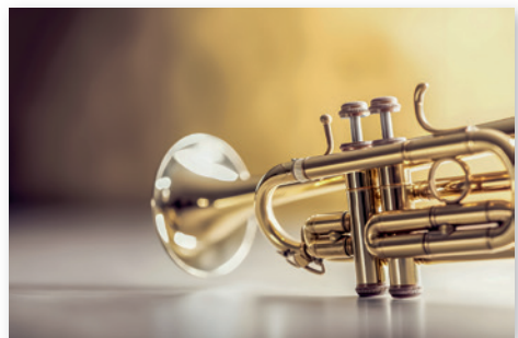
Glänzendes Blech macht einen Teil der Ausstrahlung aus..