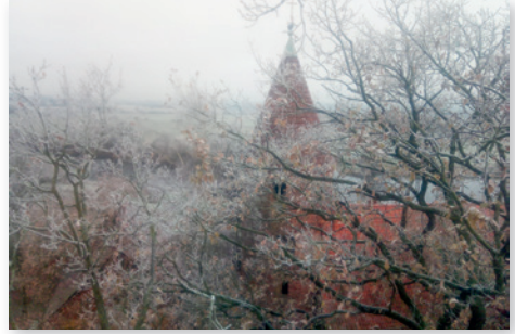
Ein besonderer Blick auf die Kirche.

Anfang des Jahres wurden alle Bäume rund um die Kirche begutachtet und haben einen Verjüngungsschnitt bekommen. Die 1000jährige Eiche entpuppte sich dabei als Sorgenkind, da sie Hohlräume im Stamm aufweist. Dank fachgerechter Einkürzung der Krone hat sie aber nun noch einige Jahrzehnte vor sich. Bei dieser Gelegenheit entstanden ganz besondere Bilder, die Claudius Lohmann der Redaktion freundlicherweise zur Veröffentlichung überlassen hat.