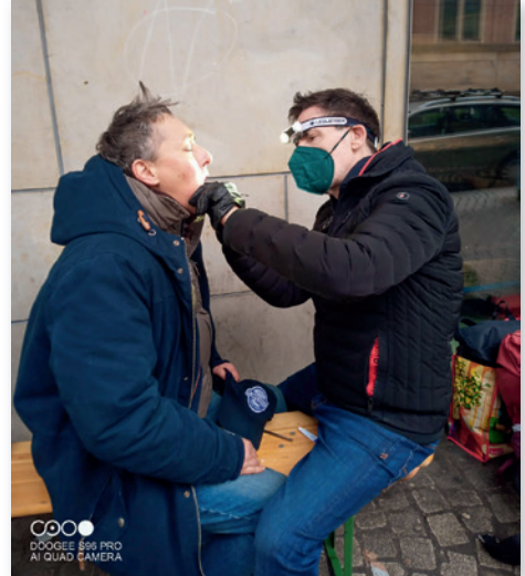
Zahnmedizinische Behandlung von Obdachlosen Menschen mitten in der Stadt

Wer jetzt denkt, dass dies eine völlig an den Haaren herbei geführte, fiktive Geschichte ist, irrt. Bis auf den Namen