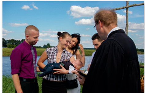
Tauffest 2013 an der Aller