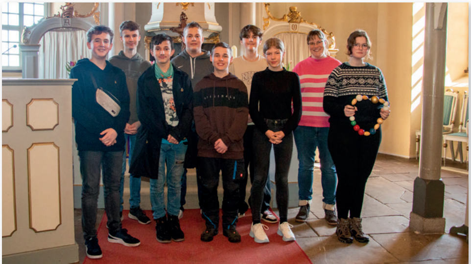
Die Konfirmanden probten fleißig.

Die Redaktion wünscht allen Konfis, dass ihnen der Glaube im Leben immer Halt und Sicherheit geben wird.