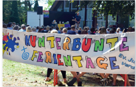
Bühnenprogramm an der Kapelle im Jahr 2022

Vom 7. bis 11.08.2023 treffen sich bis zu 100 Kinder aus dem ganzen Kirchenkreis zu dieser Stadtranderholungsmaßnahme und erleben jeweils von 9 bis 16 Uhr fünf tolle Tage mit Spiel, Spaß und spannenden Geschichten.