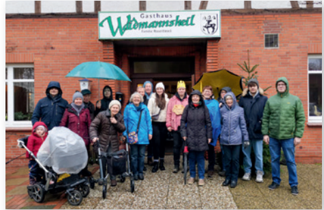
Trotz Nieselwetter viel Spaß gehabt