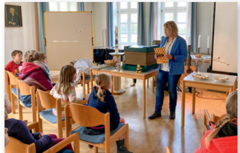
Imkerei zum Anfassen