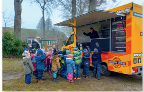
Wer will eine Portion Pommes?