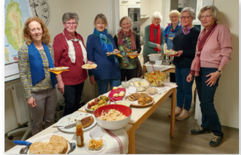
Die Vorbereitungsgruppe nach vollbrachter Arbeit.