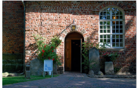
Offene Kirche St.-Annen