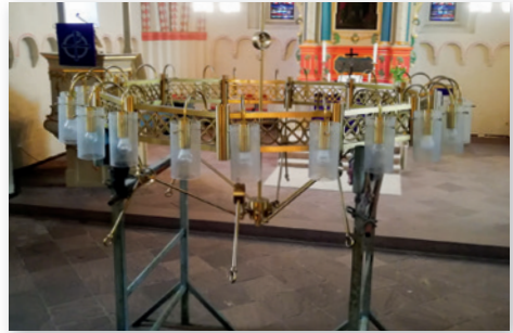
Der große Leuchter wird mit Strahlern bestückt und höher gehängt

Die gesamte Umsetzung dieses Projektes war nur auf Grund des freiwilligen Kirchgeldes und von Einzelspenden möglich. Dafür danken wir allen Spenderinnen und Spendern von ganzem Herzen.