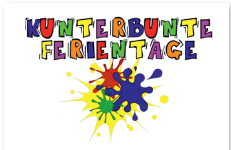
Das offizielle Logo der Kunterbunten Ferientage